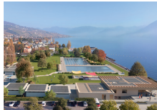
Photomontage : vue d'ensemble du projet

Le port de plaisance de Pully a été construit dans le milieu des années 70. Des travaux d'entretien sont régulièrement entrepris pour en assurer une exploitation optimale; toutefois, aucune rénovation d'importance n'a été réalisée ces 50 dernières années. Parallèlement, la liste d'attente pour obtenir une place d'amarrage est particulièrement longue et il n'est pas rare d'attendre 20 ans pour s'en voir attribuer, sachant que l'offre de places d'amarrage est actuellement à son maximum. Ces constats faits, un audit des infrastructures suivi d'un avant-projet de réaménagement de la disposition des places ont été initiés afin de déterminer si d'autres configurations permettraient d'augmenter le nombre de bateaux. A ce stade, plusieurs variantes ont été étudiées. La plus aboutie permettrait une augmentation d'environ 40 places d'amarrage ainsi que l'installation d'un nouveau système d'amarrage de type «catway» offrant un meilleur confort pour les usagers et usagers tout en réduisant les frais d'entretien. L'augmentation du nombre de places ainsi qu'un nouveau tarif des taxes d'amarrage permettra d'amortir rapidement les montants engagés pour la rénovation. Ce sujet concernera la prochaine législature.