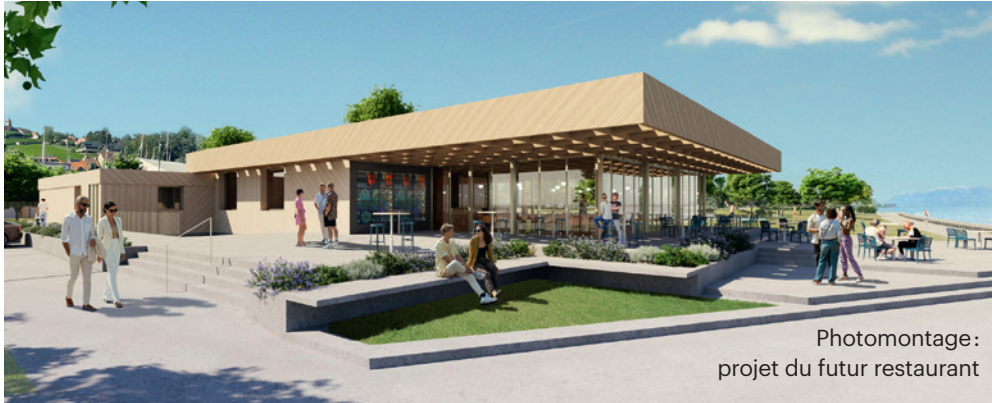
Photomontage: projet du futur restaurant